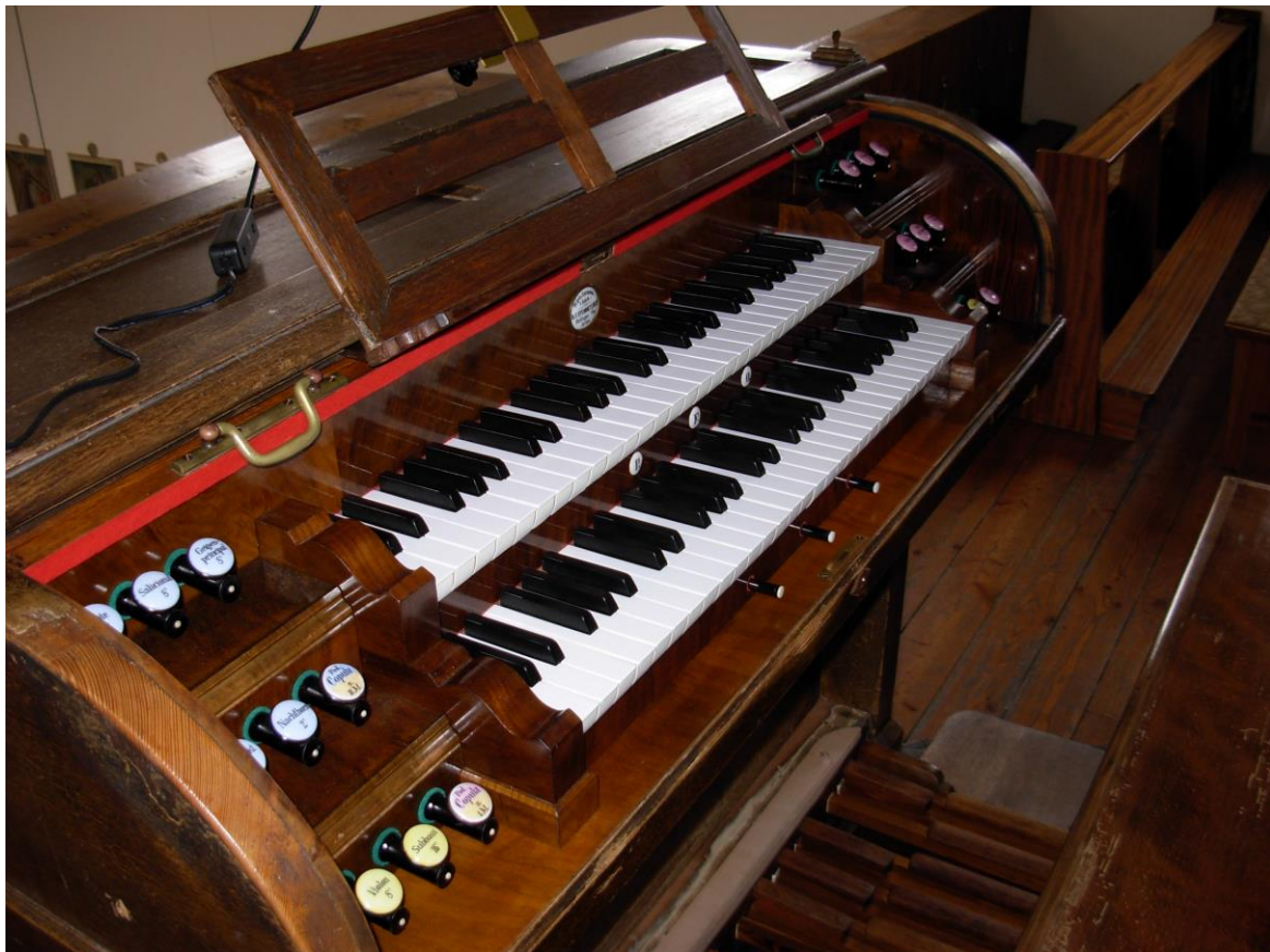
Der restaurierte Spieltisch