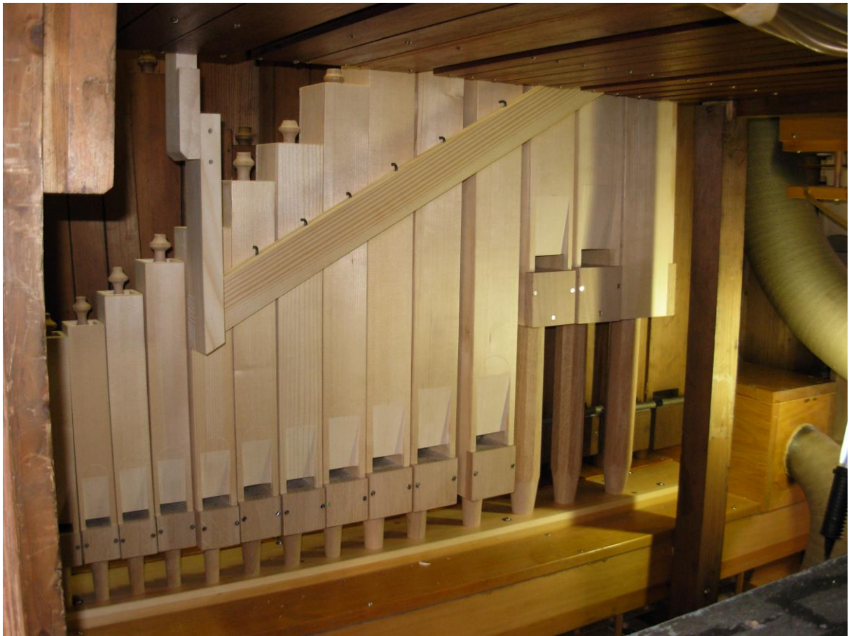
Oben: Gedeckt 8' im Pedalwerk